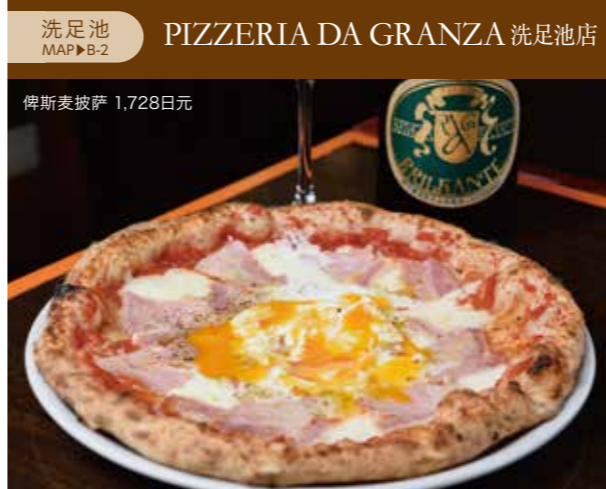
洗足池 MAP▶B-2 PIZZERIA DA GRANZA 洗足池店