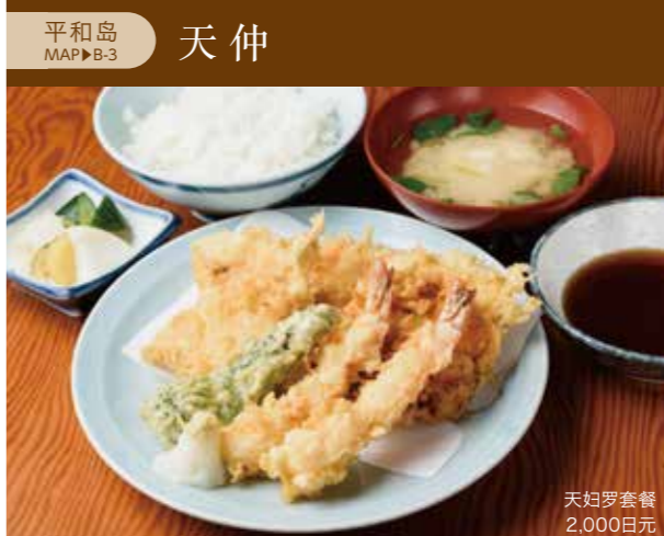
平和岛 MAP▶B-3 天仲