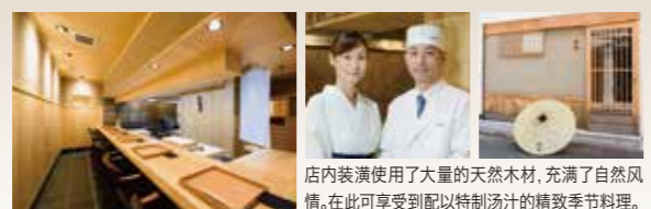
店内装潢使用了大量的天然木材,充满了自然风情。在此可享受到配以特制汤汁的精致季节料理。

● 15座 休 周日、周一 ● 18:00~23:00 下单截止时间 22:00 ● 大田区蒲田3-17-16 ● 03-6715-9727 ● 10,000日元~ ● 从京急“京急蒲田”站步行6分钟