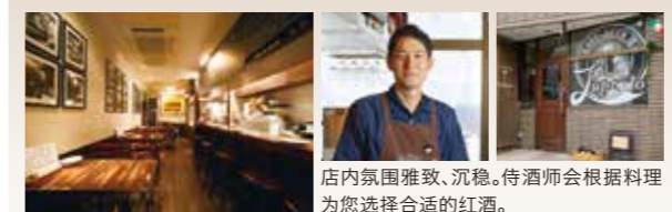
店内氛围雅致、沉稳。侍酒师会根据料理为您推荐合适的红酒。

五花肉中内夹香草和火腿烧制而成的“烧猪肉”好评如潮。店家特制的意大利面和面包以及意大利产的精酿啤酒也是极具人气。