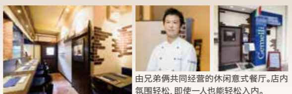
由兄弟俩共同经营的休闲意式餐厅。店内氛围轻松,即使一人也能轻松入内。

将独特调味的肉圆与蔬菜一起煎炒的“意式猪肉圆”深受大家喜爱。这家餐厅引以为豪就是各式原创的特色料理。