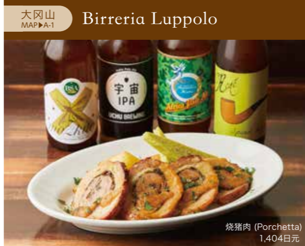
大冈山 MAP▶A-1 Birreria Luppolo