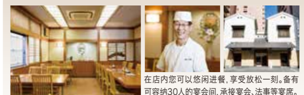
在店内您可以悠闲进餐,享受放松一刻。备有可容纳30人的宴会厅,承接宴会、法事等要席。

芝麻油100%、香气浓郁的江户式天妇罗 创立于1897年。使用当季食材,并以100%的芝麻油炸制而成的江户式天妇罗,其芬芳的香味一如往昔,受当地食客的钟爱。