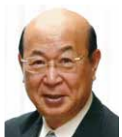
大田区长 松原 忠義

自2010年开始的“OTA! 推荐饮食”活动,到今年已经是第8个年头。每年,我们都会收到很多好评,我们也得以向区内区外推广介绍我们的活动。东京2020奥运会、残奥会的举办,是我们向世界介绍“美食大田区”的良机。为了确立美食大田的品牌,我们与以受表彰店铺为代表的区内各餐饮店一起合作,积极推进各项工作。希望您在看到本宣传资料后,能够前来大田区品尝、享受这里的各式料理、氛围和服务。