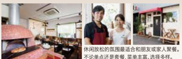
休闲放松的氛围最适合和朋友或家人聚餐。不论单点还是套餐,菜单丰富,选择多样。

由2位获得过日本第一的比萨厨师监制窑烤比萨口感松软Q弹。使用马苏里拉奶酪与意大利原产火腿内的“俾斯麦”比萨,配上半熟蛋一起品尝更美味。