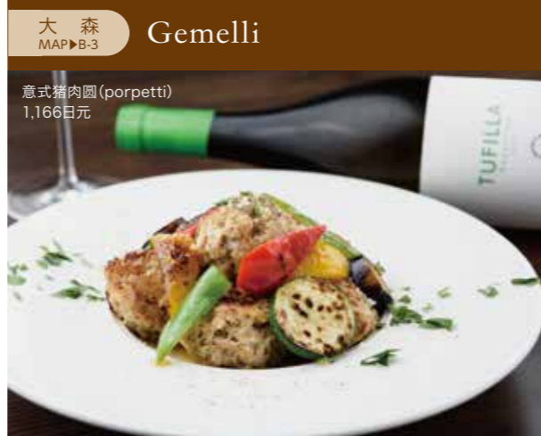
大森 MAP▶B-3 Gemelli