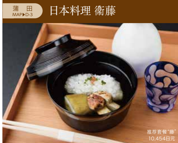
蒲田 MAP▶D-3 日本料理 衛藤