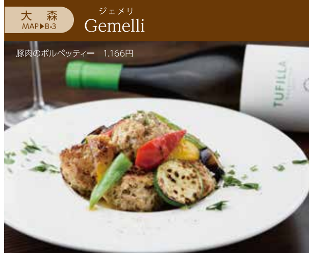
大森 ジュメリ Gemelli