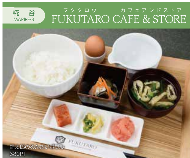
福太郎のめんとたいボウル 680円