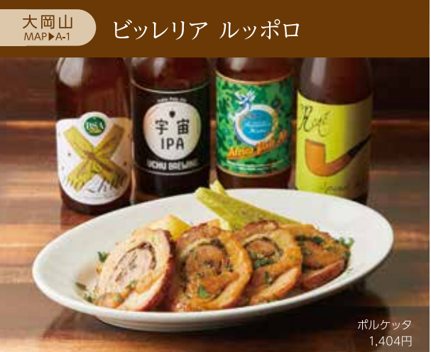
大岡山 ビツレリア ルッポロ