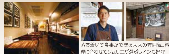
落ち着いて食事ができる大人の雰囲気。料理に合わせてソムリエが選ぶワインも好評

豚バラ肉に香草とハムを挟んで焼き上げる「ポルケッタ」が好評。自家製パスタやパン、イタリア産クラフトビールも人気。