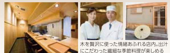
木を贅沢に使った情緒あふれる店内。出汁にこだわった繊細な季節料理が楽しめる

時季の恵みを用いた料理を季節感あふれる器に盛り付けて提供。一年中、その時期で最も美味しい生牡蠣も味わえる。