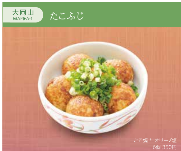
たこ焼き オリープ塩 6個 350円