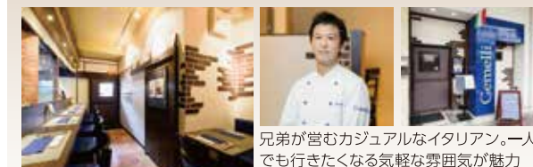
兄弟が営むカジュアルなイタリアン。一人でも行きたくない居心地の良い店

独自の味付けによるミートボールを野菜と一緒にソテーした「ボルペッティー」が人気。オリジナリティあふれる創作料理が自慢。