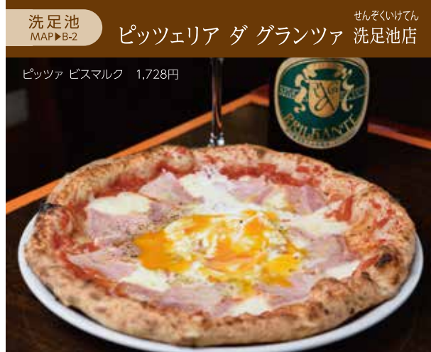
洗足池 ピッツェリア ダ グランツァ 洗足池店