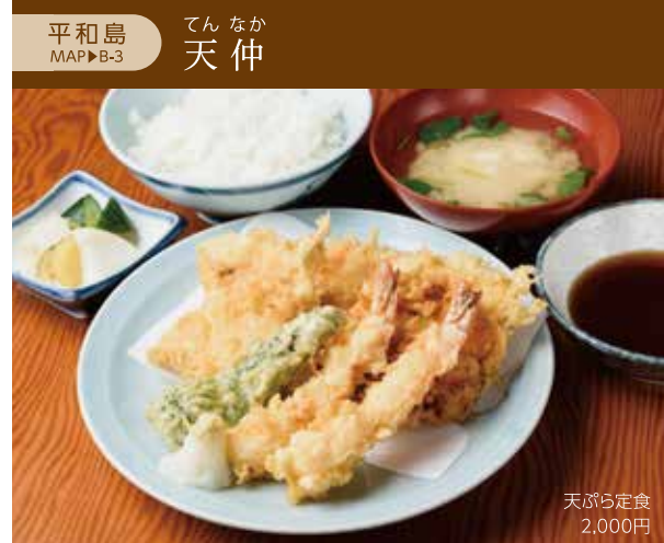
平和島 てん なか 天 仲