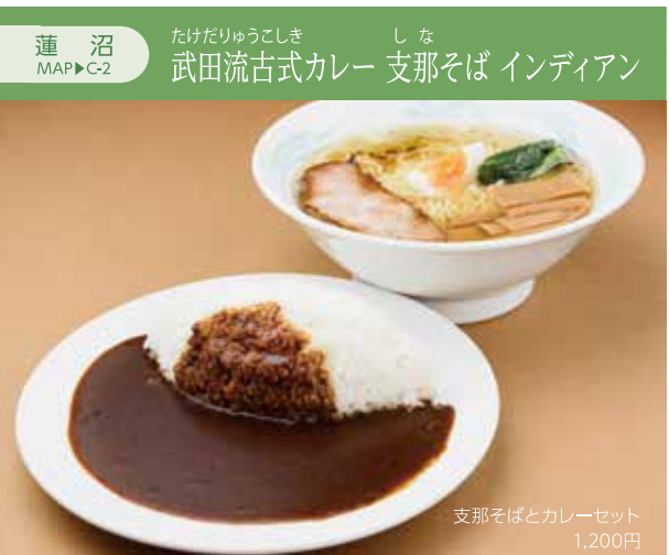
支那そばとカレーセット 1,200円