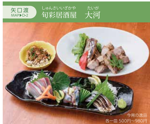
今宵の逸品 各一皿 500円～980円