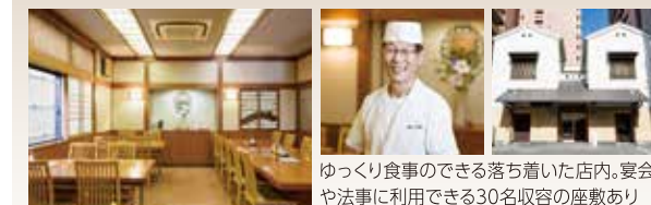
ゆっくり食事のできる落ち着いた店内。宴会や法事に利用できる30名収容の座敷あり

創業明治30年。旬の素材をごま油100%で揚げる江戸前天ぷらは昔ながらの香ばしい味わい。地元客に親しまれている食事処。