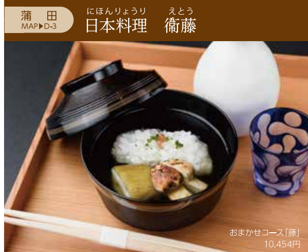
おまかせコース「豚」 10,454円