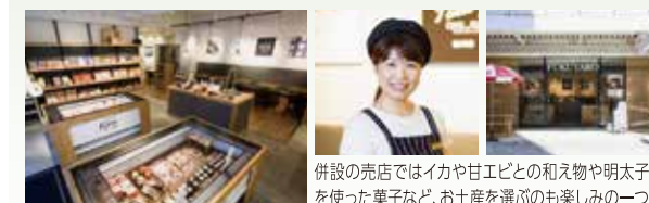
併設の売店ではイカや甘エビとの和え物や明太子を使った菓子など、お土産を選ぶのも楽しみの一つ

辛さを控え、旨みを大切にした明太子のバリエーション豊かな味わいを日替わりで楽しめる。明太子のお替わりは自由。