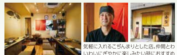
気軽に入れるごはんまりとした店。仲間とわいわいにぎやかに楽しみたい時におすす

北海道直送の新鮮でクセのないラム肉を使用。クセのあるマトンや熟成肉も用意され、ジギスカン以外のメニューも豊富。