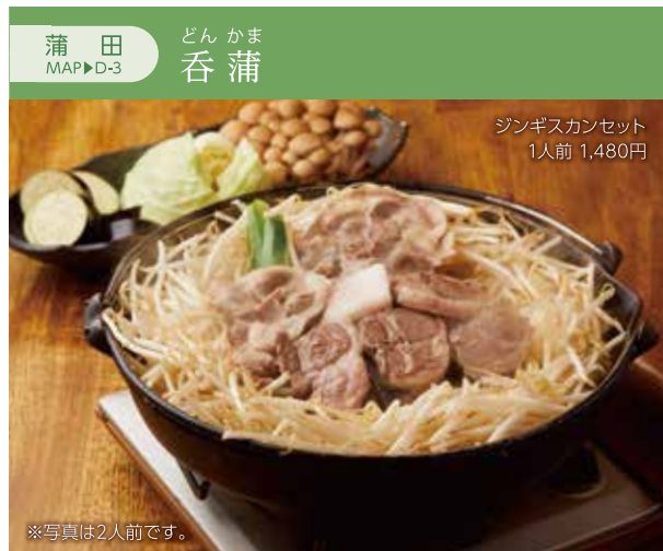
ジギスカンセット 1人前 1,480円