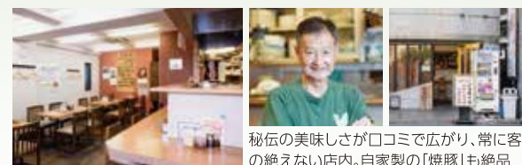
秘伝の美味しさが口コロまで広がり、常に客の絶えない店内。自家製の「焼豚」も絶品

野菜の旨味が生きた塩味の支那そば。魚がし玉葱のコクが楽しめるポークカレー。60年の伝統を受け継ぐ味がここにある。