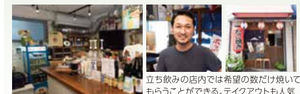
立ち飲み店内では希望の数だけ焼いてもらうことができる。テイクアウトも人気

関西出身の店主が作るたこ焼きは、外はパリッと中はふっくら。注文を受けてから焼かれるのでいつでも出来たてが味わえる。