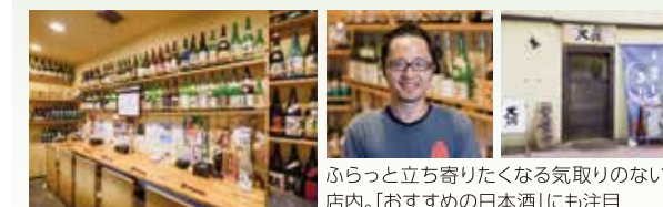
ふらっと立ち寄りたくなる気取りのない店内。「おすずめの日本酒」にも注目

刺身盛り合わせや豚肉の西京焼きなど日替わりメニューが豊富。季節の食材を用いた料理をリーズナブルな価格で味わえる。