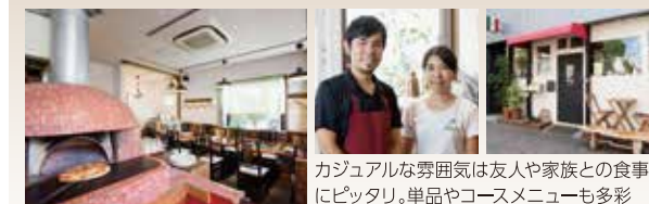
カジュアルな雰囲気は友人や家族との食事にピッタリ。単品やコースメニューも多彩

薪窯で焼くピッツァはもちもちの食感。モッツァレラチーズとイタリア産ハムを使用した「ビスマルク」は半熟卵と一緒に。